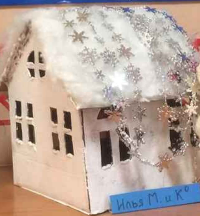
Ильва М. и К о