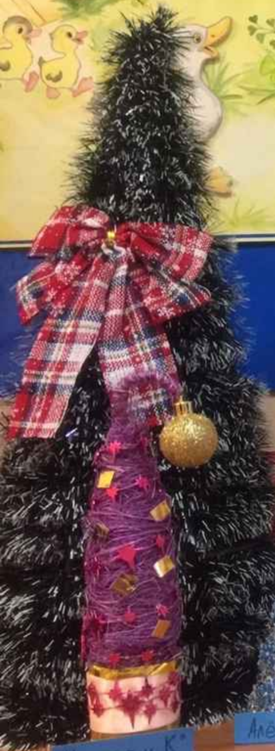
Никита и К о